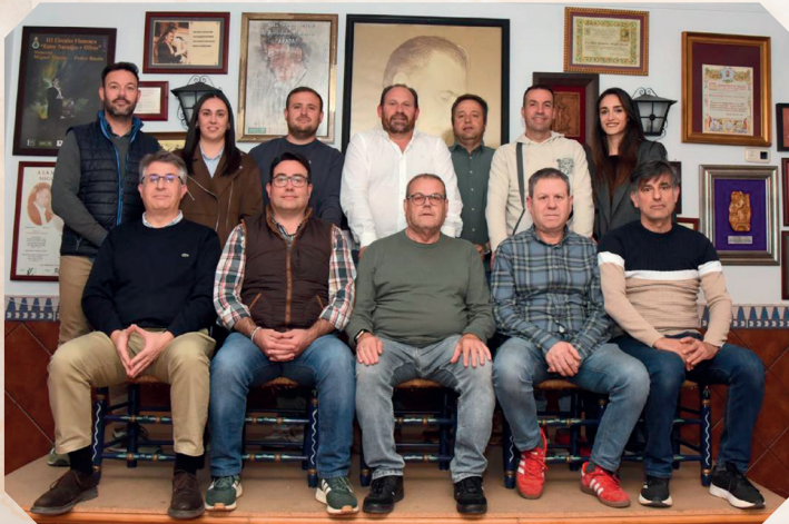
Junta Directiva de la Peña Cultural Flamenca "Miguel Vargas".

Nuestra peña, conjuntamente con el Ayuntamiento, mantenemos y mimamos cada semana con todo el cariño que merece el trabajo realizado a través de las 35 ediciones anteriores para que no caiga en saco roto. Con el recuerdo permanente de nuestro titular, Miguel Vargas, y en el convencimiento de que acudiréis durante las actividades previas y durante la semana a apoyar este magno evento, recibid un cordial saludo. Os esperamos a todos. Que lo disfrutéis.